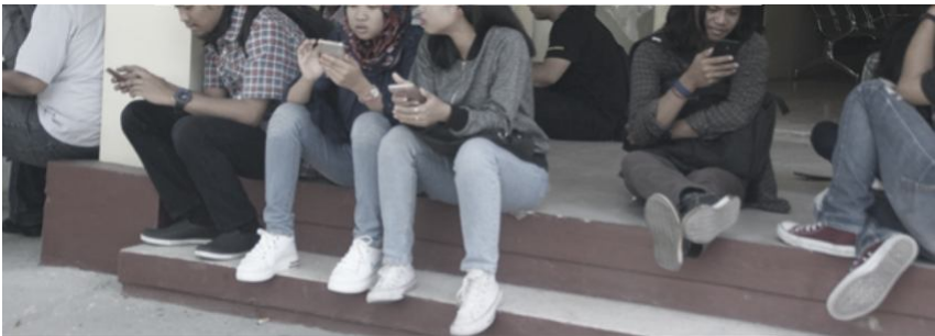
Gambar 1. Dampak negatif pengenalan budaya baru. Smartphone menjadi kebutuhan pokok untuk bermain game dan mendapatkan hiburan.

Bisa dibayangkan bahwa situasi di atas di samping merubah orientasi kerja juga merubah selera secara umum. Karena orientasi berubah maka seleraapun berubah untuk mengadaptasi lingkungan dan nilai baru di atas. Mereka yang dulunya intens dalam merefleksikan kehidupan sosial dan religius sekarang memilih menggunakan peralatan teknologi berupa games , gadget, dan sosial media yang dapat memenuhi kebutuhan permainan dan hiburan. Produk-produk hiburan yang dapat merepresentasikan keadaan nyata di sekitar kita seperti home teater dan imej yang dihasilkan oleh teknologi komputer semakin mendapat tempat istimewa dalam kehidupan masyarakat. Tidak jarang hal ini mengakibatkan dampak negatif terhadap kehidupan mereka. Misalnya, keasyikan untuk menggunakan teknologi gadget dan sosial media telah menyita banyak waktu yang seharusnya dapat digunakan untuk kegiatan lain yang lebih bermanfaat. Dampak negatif seperti ini telah dirasakan akhir-akhir ini selagi masyarakat belum siap untuk mengambil keputusan tentang sikapnya terhadap budaya baru tersebut.