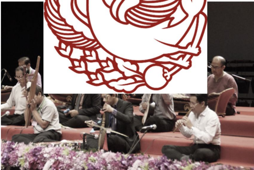
Gambar 3. Kesenian memberikan tontonan, tatanan, dan tuntunan bagi seniman dan masyarakatnya (Foto: Santosa, 2018).

penginderaan tersebut. Tari, teater, wayang dan lukisan enak dipandang mata karena dapat memenuhi kebutuhan visual. Sementara itu, musik, gamelan, hadrah dan sebagainya memberikan asupan untuk pendengaran. Para penonton terpuaskan secara auditif. Di level kedua seni merepresentasikan tatanan yaitu aturan-aturan yang berlaku dalam kehidupan sosial. Di sini seni mewujudkan norma-norma yang dianggap baik dalam komunitasnya. Seni dianggap sebagai representasi aturan karena di dalamnya terdapat aturan dan ajaran untuk kemajuan masyarakat. Di level ketiga seni menjadi penuntun untuk tingkah laku manusia dalam arti memberikan contoh-contoh kebaikan yang dapat ditiru seperti halnya normal dan etika sosial. Konten seni merepresentasikan tuntunan yang dapat memberikan arah kebajikan dalam tingkatan nilai bermasyarakat.